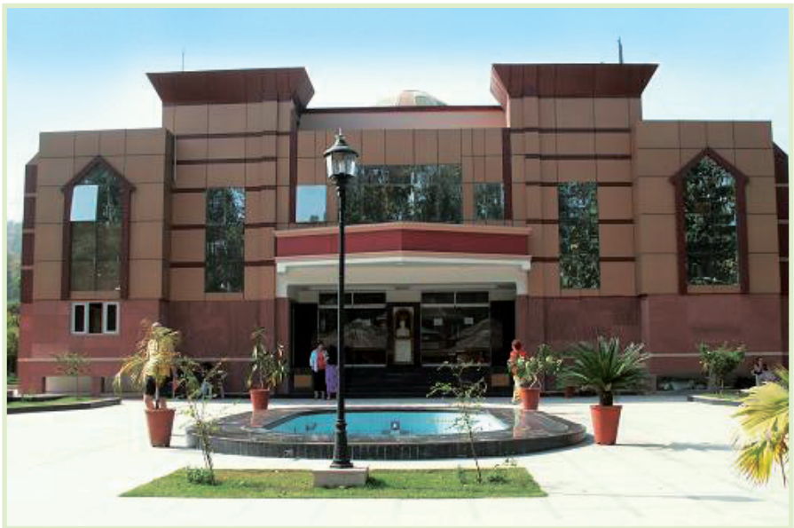
Prakash Deep Institute of Ayurvedic Sciences, de kliniek en het stagecentrum in Raiwala, India